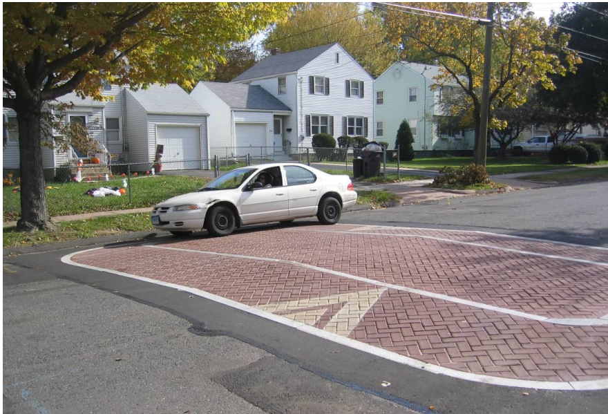
Slika 5 - Izdignuće na kolniku izvedeno kombinacijom asfalta i betonskih elemenata [7]

Uz sve navedene mogućnosti smirivanja prometa, i dalje se razmišlja o učinkovitim i jeftinim načinima smirivanja prometa pa je tako jedno neuobičajeno, a zanimljivo rješenje moguće vidjeti u manjim austrijskim mjestima gdje je ispred pješačkih prijelaza i škola postavljen dvodimenzionalni lik policajca u pravoj veličini.