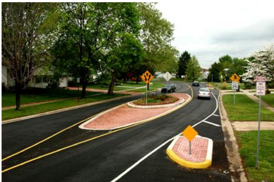
Slika 3 - Primjer razdvajanja smjerova vožnje izvođenjem prometnih otoka [5]

Sva rješenja problema ugroženosti nezaštićenih sudionika u prometu trebaju biti, u danim uvjetima, tehnički izvediva i jeftina te ne smiju ići na štetu ograničavanja propusne moći prometnice i pokretljivosti svih sudionika. Naime, ako je rješenje neudobno, motorizirani sudionici bi mogli početi izbjegavati određenu dionicu, a u tom slučaju bi svako smirivanje prometa izgubilo smisao jer bi postalo zabrana, nikako rješenje uvjetovanog kretanja.