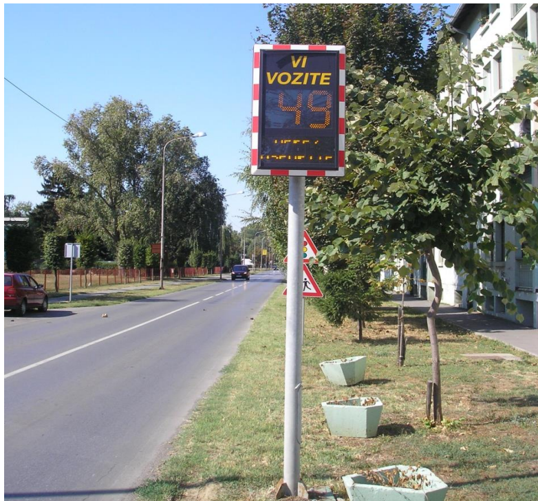
Slika 6 - Smirivanje prometa uređajem za određivanje brzine vožnje

prometnih trakova otocima, prenamjena dijela vozne površine u parkirnu, zamjena klasičnih raskrižja kružnima i slično, a sve radi prisiljavanja vozača na tzv. slalomsku vožnju i smanjenje brzine.