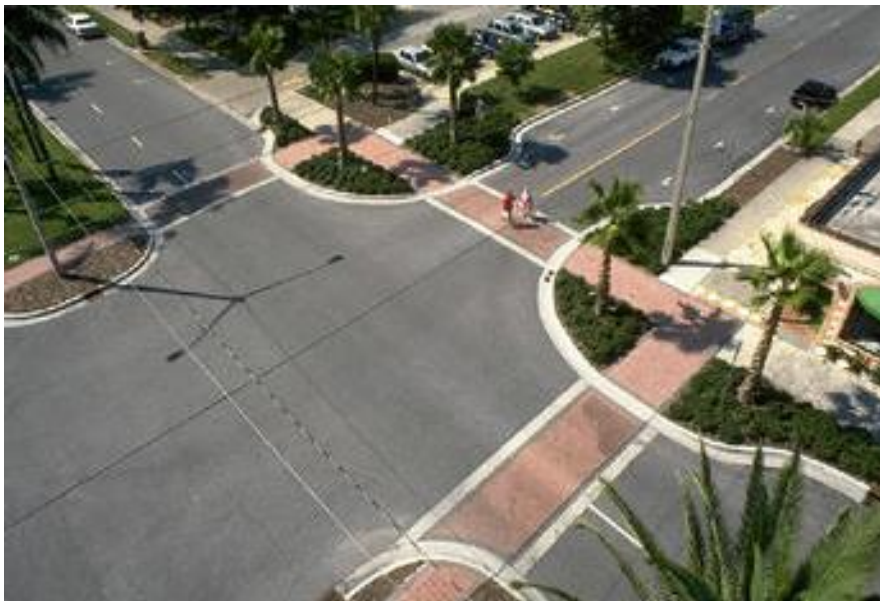
Slika 4 - Primjer suženja vozne i proširenja pješačke površine [6]