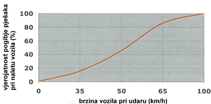
Slika 1 - Utjecaj brzine vožnje na vjerojatnost pogibije pješaka prilikom sudara [2]

Razvitak prometa te visok stupanj motorizacije, uz sve važne prednosti u zadovoljenju potreba mobilnosti stanovnika u gradovima, izaziva i negativnosti među kojima se posebno ističu prometne nesreće. S jedne strane postavlja se zahtjev za pokretljivošću i što većom brzinom, a s druge strane upravo velika brzina kretanja ugrožava sigurnost sudionika u prometu, posebno pješaka, biciklista, djece i hendikepiranih osoba. Brojna istraživanja [1, 2] potvrdila su vrlo usku vezu između brzine kretanja vozila i težine posljedica (povreda) za pješake i bicikliste u prometnim nesrećama. Prema domaćim istraživanjima [1] granična brzina pri kojoj nema težih posljedica za nezaštićene sudionike u prometu iznosi 30 km/h. Na temelju provedenih inozemnih istraživanja [2], graničnu brzinu između nastanka lakših i težih povreda pješaka i biciklista prilikom nalijetanja vozila čini brzina vožnje od 36 km/h (slika 1).