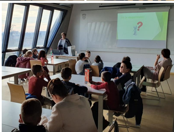
Za e-GFOS pripremio: doc. dr. sc. Ivan Kraus