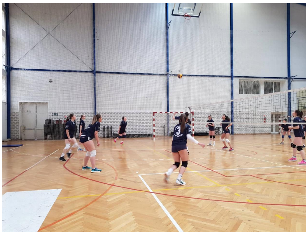
Odbojkašice tijekom napete utakmice koja je završila pobjedom 2018./2019.

Za e-GFOS pripremila: Iva Belani-Kizivat, studentica