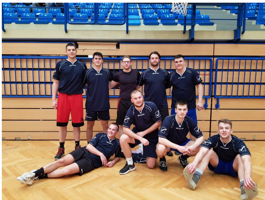
Ekipa košarke 2018./2019.