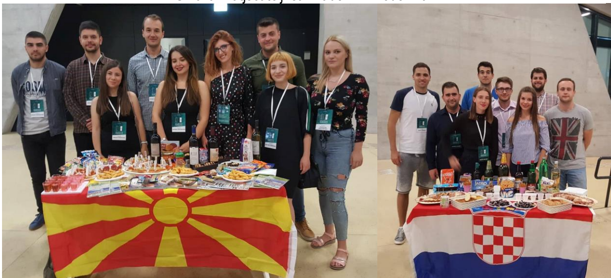
Slika 7. Kulturna večer