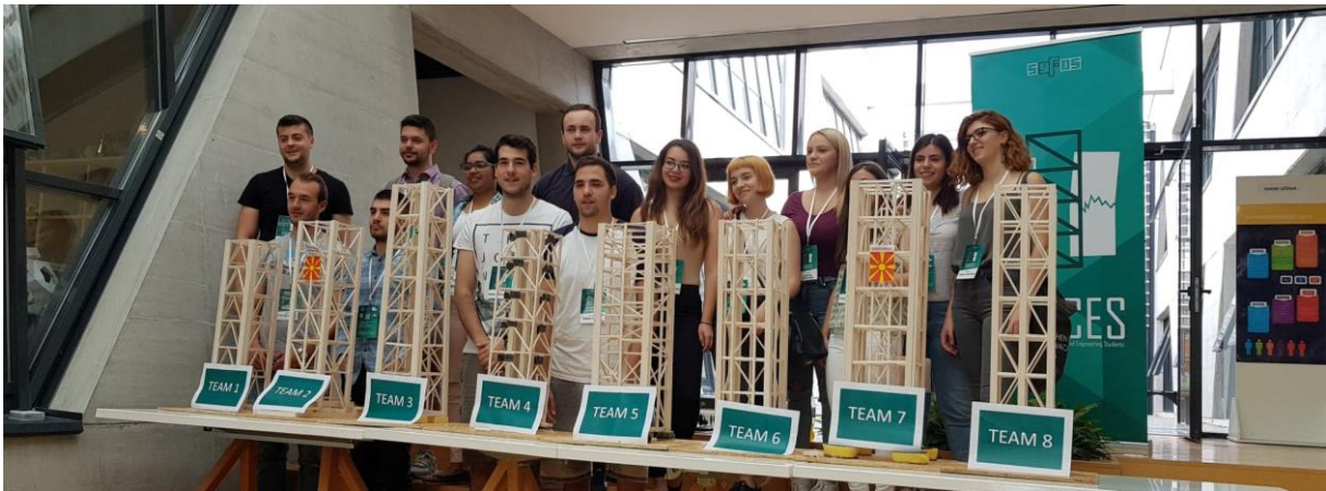
Slika 6. Natjecatelji sa izrađenim modelima