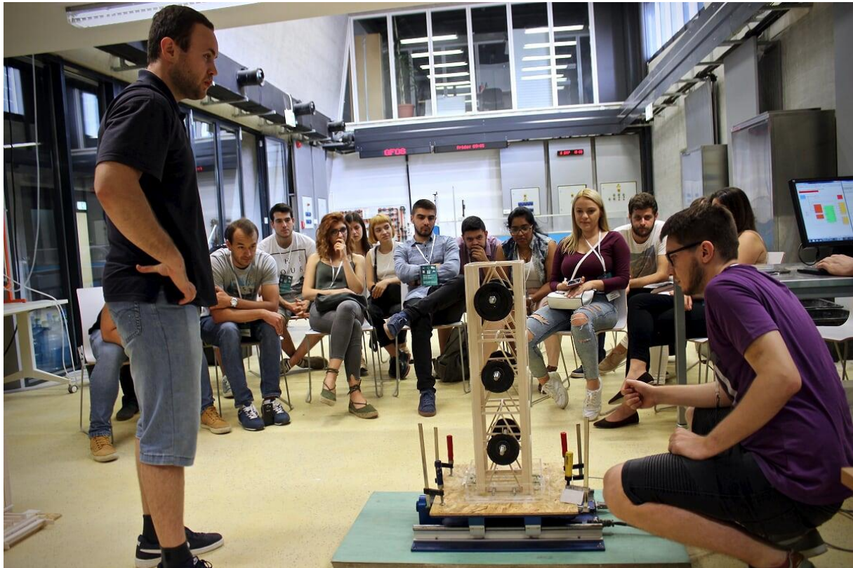
Slika 5. Ispitivanje modela na potresnom stolu