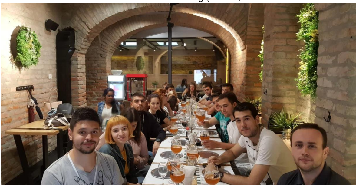
Slika 9. Večera (Merlon)

Za e-GFOS pripremio: Hrvoje Glavaš, student