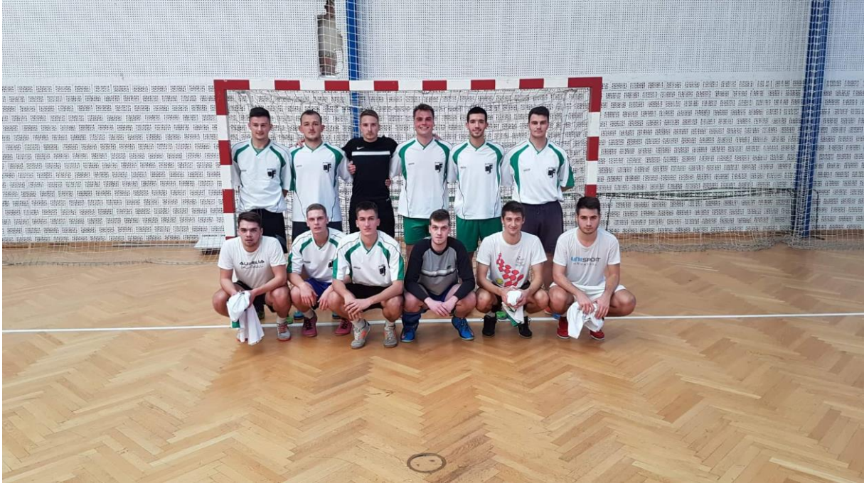
Ekipe malog nogometa 2018./2019.

Vrijedno je spomenuti i veslanje koje se održalo na Jarunu, na kojemu je sudjelovao Marko Pirić u sklopu sveučilišne ekipe koja je osvojila 4. mjesto.