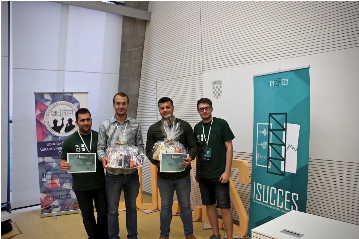
Slika 3. Pobjednici u izradi modela od balze