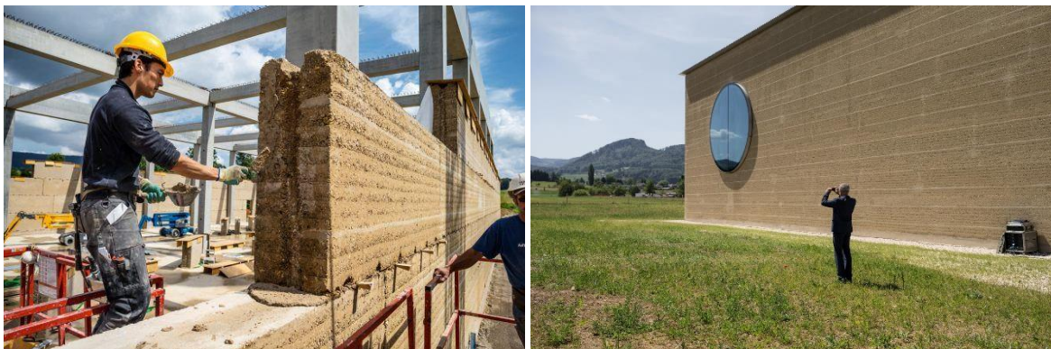
Herzog & de Meuron, Ricola Herb Centar, 2014.

Drugi dio predavanja obuhvatio je detaljnije upoznavanje sa svojstvima zemlje kao materijalom u arhitekturi u kojoj je predstavljena kao materijal koji se primjenjuje u različitim tehnikama gradnje: nabojem, sušenom opekom, kao ispuna u kanatnoj gradnji, završni sloj i drugo. U trećem dijelu predavanja je predavačica predstavila primjere suvremene arhitekture, u prvom redu arhitekta Martina Raucha, zatim svjetski poznatog dvojca Herzog i de Meurona, finske arhitektice Rudanko + Kankkunen i drugih, koji su zasigurno razbili predrasude o zemlji kao materijalu koji za sebe veže isključivo arhetipske forme.