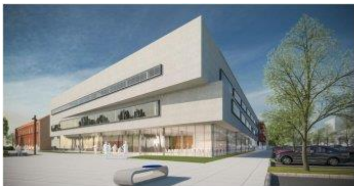
Druga nagrada (autor: Goran Jagić, dipl.ing.arh.)