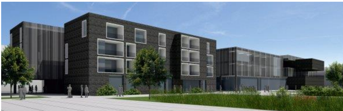
Prva nagrada (autori: Rajka Bunjevac, dipl.ing.arh. i Boris Petrović, dipl.ing.arh.) Pogled iz unutarnjeg dvorišta