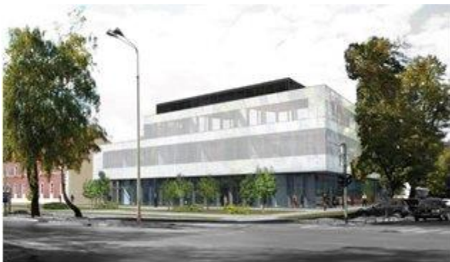
Treća nagrada (autori: Siniša Bodrožić i Ivan Rališ)