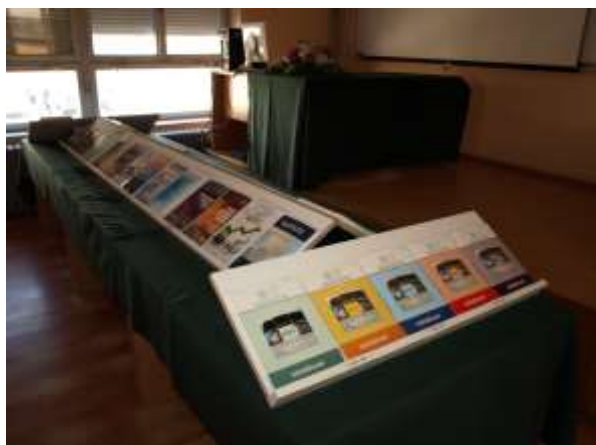
Izložba fakultetskih izdanja

Prije početka programa zainteresirani su mogli pogledati izložbu knjiga i skripata, izdanja Građevinskog fakulteta Osijek u posljednjih 10 godina, od 2005. do 2015. g.