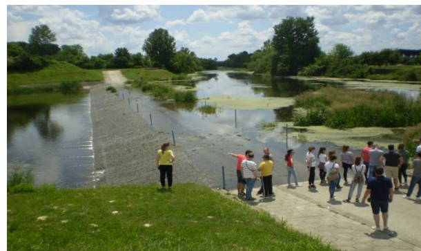
Na crpnoj stanici / ustavi melioracijskog kanala Biđ-Bosutskog polja i Preljev na boku Bosuta početak je prokopa Bazjaš