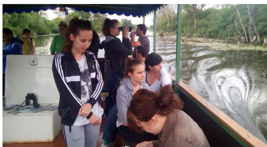
Turistički brodić Sv. Katarina vozi Bosutom i omogućuje razgled prirodnih ljepota

Za e-GFOS pripremili: mr.sc. Siniša Maričić Valentina Sekelj, studentica