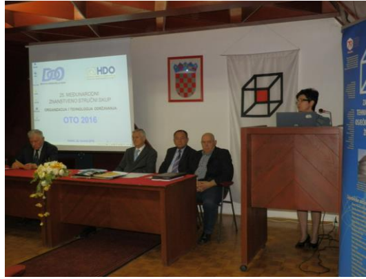
Za e-GFOS pripremio: prof.dr.sc. Zlatko Lacković