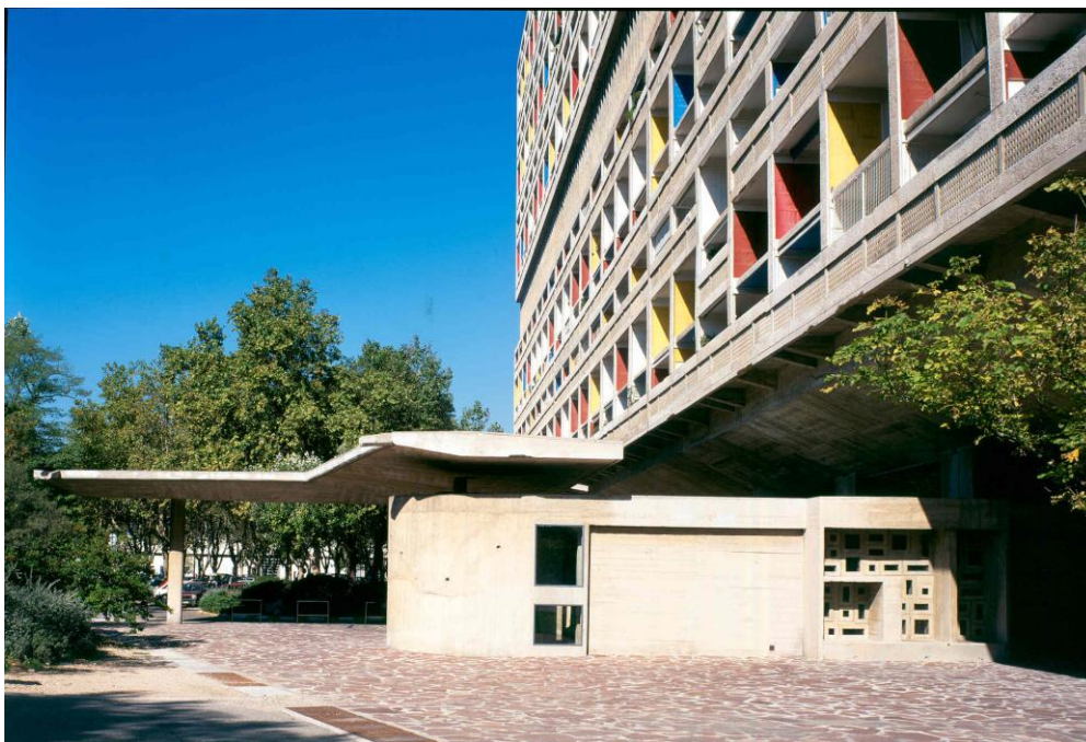
Slika 4 – Le Corbusier: Unité d'habitation de Marseille, Marseille, 289 Boulevard Michelet; 1952.

Marseilleski Unité (slika 4) ima 337 stanova u 23 tipa, od hotelske sobe do stana za obitelj s 4 do 8 djece, koji ukupno ima pet spavaćih soba i standardan dnevni prostor s kuhinjom (jednak za sve dvoetažne stanove). Širina raspona stupova u prizemlju je 8,38 metara osno (16 rastera), a taj je raspon u gornjim etažama prepolovljen – 4,19 metara (32 rastera). Čitava zgrada ima jedan ulaz sa središnjim stubištem i liftovima, smještenim na južnoj polovici, te dva evakuacijska stubišta i dva za vatrogasce, koji su međusobno raspoređeni na udaljenosti od 44 metra (polumjer 22 m), što je dalo relativno složen tlocrt prizemlja karakterističnog po jednoličnome rasporedu stupova osnovne nosive konstrukcije. U literaturi je najčešće referiran tip stana s tri spavaće sobe u varijanti sa spavanjem gore ili dolje, ovisno ide li se iz ulaznoga prostora u spavaći dio gore ili dolje [2,6]. Dnevni prostor dvostruke visine je smješten u spavaćoj etaži, galerijski je otvoren prema gornjoj, ulaznoj etaži i od roditeljske spavaće sobe odvojen pregradnim paravanom, tako da spavaća soba dobiva dnevno svjetlo preko vertikalnih, uskih otvora u paravanu.