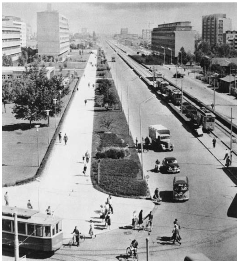
Slika 1 – Ulica grada Vukovara u Zagrebu sredinom 1950-ih (tada Beogradska i Ulica proleterskih brigada). Zgrada lijevo višestambena zgrada Drage Galića na broju 35, 35a.

Stambena zgrada u Ulici grada Vukovara 35/35a – velikom bulevaru koji se gradio u socijalističkoj epohi zagrebačkog urbanizma [4], Galićeva je zgrada koja je odmah po izgradnji izazvala stanovitu pomutnju među arhitektima i kritičarima arhitekture, i to vjerojatno više nego ijedna druga (slika 1). Iako joj nitko ne odriče kvalitetu, većina je dovodi u vezu s marseilleskim Unitéom Le Corbusiera. Poznavatelju Galićeva opusa ovog projekta bit će jasno da se ipak radi o drugačijem pristupu rješavanja osnovnih stambenih jedinica, ali su istovremeno upotrijebljeni elementi moderne arhitekture koji dovode do brojnih sličnosti, tek na prvi pogled samo oblikovnih i sličnosti pročelja. Prije svega, tu se radi o određenom problemu koncepta, jer je zgrada u Zagrebu koncepcijski potpuno jednaka Le Corbusierovu originalnom djelu.