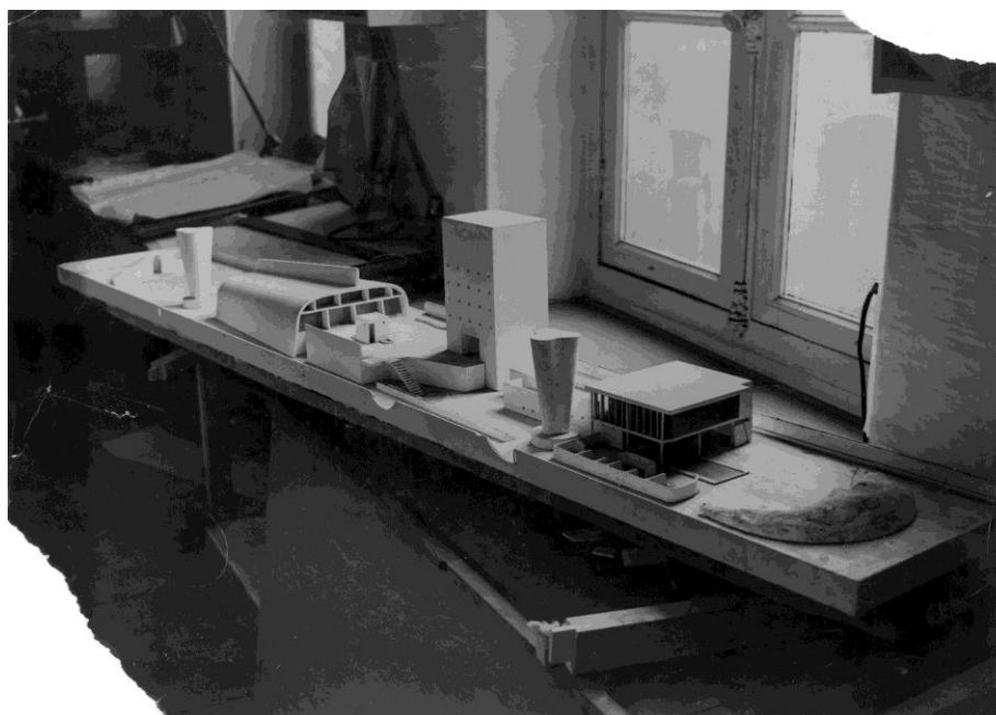
Slika 5 – Le Corbusier: maketa krovne terase marseilleskog Unitéa, početkom 1950-ih [6]

Na najvišem, sedamnaestom katu, smješteno je odmaralište za stanare – velika zajednička krovna terasa (slika 5). Jedna rampa vodi direktno na krovnu terasu gdje se nalazi, postavljena na tankim stupovima, prostorija za odmor, plitki bazen i nekoliko dječjih igrališta. Druga strana krovne terase, velike 24 x 165 metara, određena je za rekreaciju odraslih. Ovdje se nalazi dvorana za sportske aktivnosti i sportski teren, dok na sjevernom kraju velika betonska ploča služi kao zaštita od jakog sjevernog vjetrova, maestrala, a istovremeno služi kao pozadina za krovnu pozornicu.